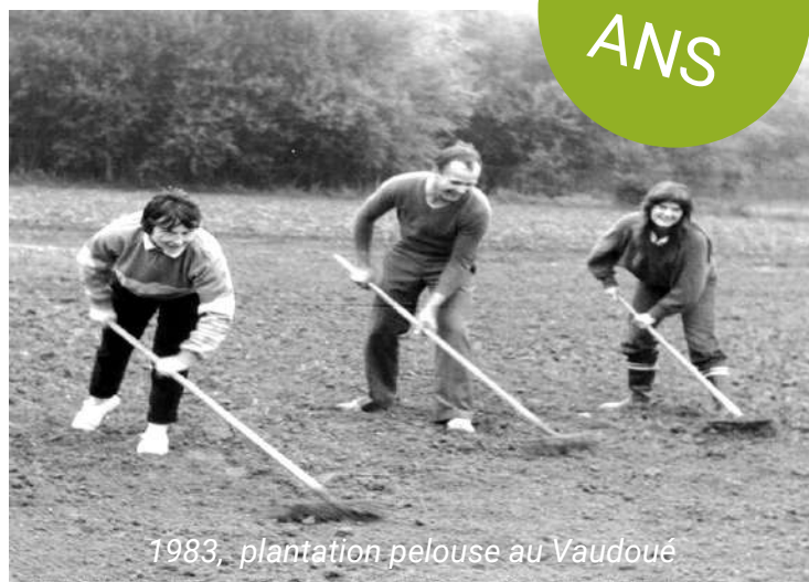
1983, plantation pelouse au Vaudoué

Côté compétition, pour la première fois cette saison, une équipe est engagée dans la Coupe Pierre David dans une compétition rassemblant les joueurs de plus de 60 ans.