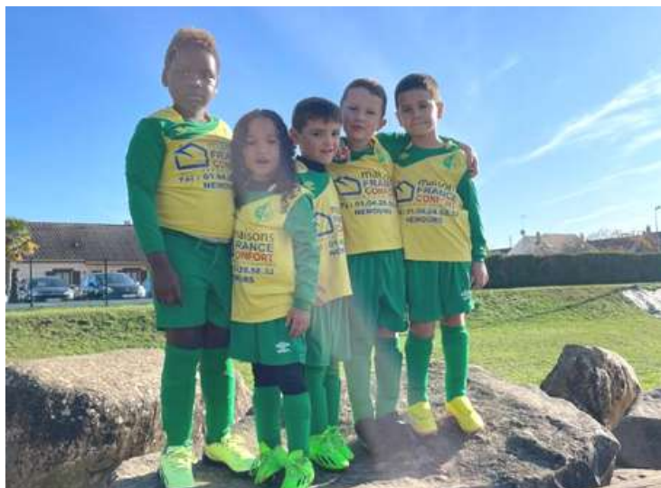
Photo ci-dessus U6 U7. - ci-dessous U8 U9

Début de saison prometteur pour les "petites stars" U6 U7 qui ont réalisé de bons plateaux.